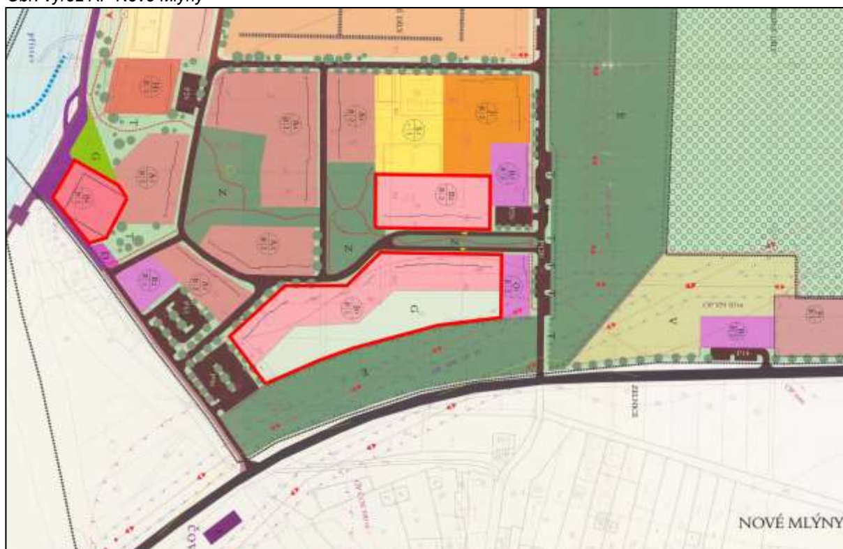
Obr. výřez RP Nové Mlýny

Další snížení rozsahu obytných ploch (o 2,2425 ha – viz. červeně vyznačené plochy na obr. výřez RP Nové Mlýny) vyplývá z úpravy koncepce řešení rekreační zóny Nové Mlýny (podrobněji viz. dílčí změna ZM1.04). Platný ÚP umožňoval v rámci rekreační zóny realizaci bydlení. Změnou č. 1 dochází ke zrušení typu plochy s rozdílným způsobem využití (Plochy smíšené – obč. vybavení, bydlení, rekreace a sportu – SA), vymezené v platném ÚP, a jejímu nahrazení novým typem (Plochy rekreační smíšené – Rs), ve kterém již bydlení není umožněno, resp. pouze omezeně v případě, že se jedná o byt správce nebo majitele zařízení.